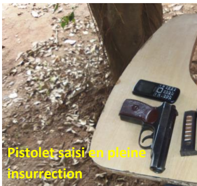
Pistolet saisi en pleine insurrection

Au sens de cette loi, le cocktail Molotov fabriqué à partir de l'essence et des morceaux de bouteilles remplis dans une petite bouteille avec éventuellement de balle est un explosif. Ce sont ces types d'armes qu'utilisaient les insurgés pour incendier les véhicules.