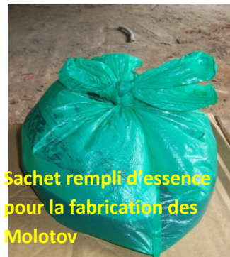
Sachet rempli d'essence pour la fabrication des Molotov