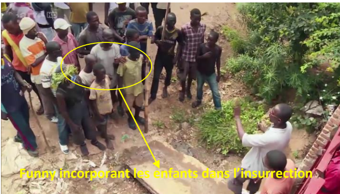
funny incorporant les enfants dans l'insurrection.

Les manifestations sont, en principe, faites par des personnes majeures susceptibles d'engager leurs responsabilités personnelles. Cependant, les organisateurs de ces manifestations ont incorporé dans leurs rangs beaucoup d'enfants pour diverses raisons.