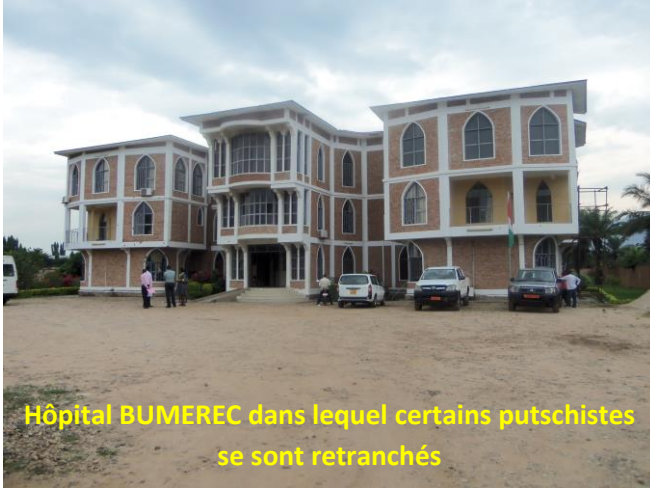
Hôpital BUMEREC dans lequel certains putschistes se sont retranchés

Les militaires mutins qui s'étaient associés aux insurgés, le 13 mai 2015, sont revenus seuls le lendemain pour mener leur dernière action en s'emparant des infrastructures de la RTNB. Ils ont échoué face à la détermination des forces de Défense loyalistes. Certains d'entre eux se sont retranchés en se repliant à l'hôpital BUMEREC.