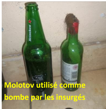
Molotov utilisé comme bombe par les insurgés