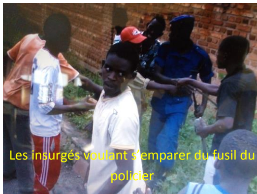
Les insurgés voulant s'emparer du fusil du policier

monté assaut sur elle avant de la traîner, faisant sur elle toute sorte de violences physiques et morales. Suite à ces violences, elle a été admise à l'hôpital pour y subir des soins.