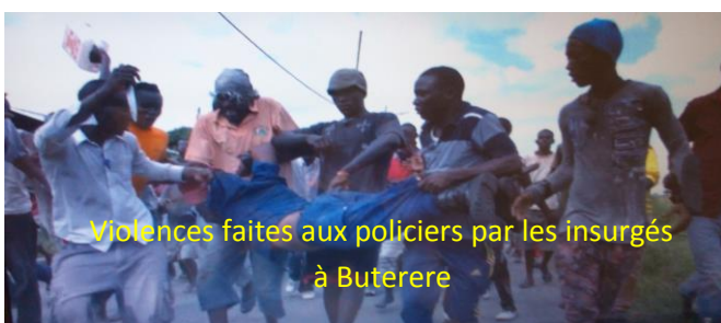
Violences faites aux policiers par les insurgés à Buterere

D'autres actes de barbarie ont été commis. Ainsi, des policiers ont été attaqués à la grenade en commune KAMENGE et au centre-ville près de l'ex-marché central de Bujumbura en date du 01 mai 2015. Ces attaques ont emporté la vie à plusieurs policiers dont le commandant zone Nord. Ces attaques ont été perpétrées au même moment ce qui montrent une coordination de la part de ces insurgés.