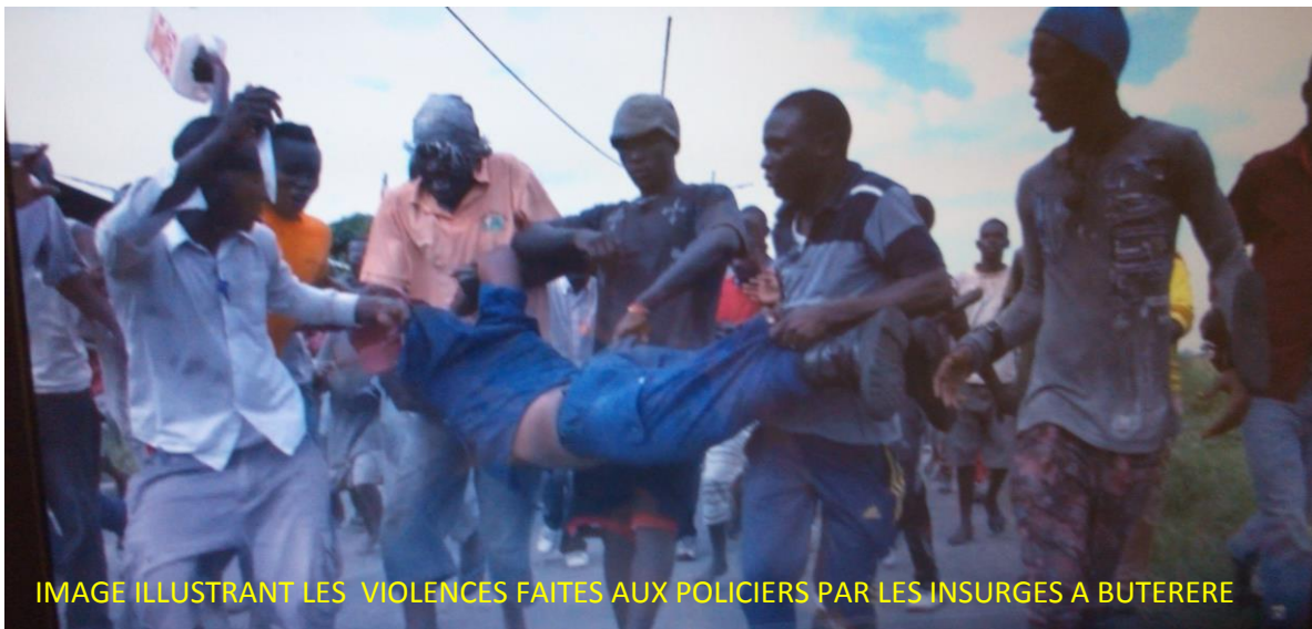
IMAGE ILLUSTRANT LES VIOLENCES FAITES AUX POLICIERS PAR LES INSURGES A BUTERERE