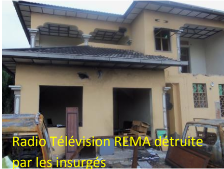
Radio Télévision REMA détruite par les insurgés

Certaines d'autres stations de radio ont été prises et gardées par les mutins. Les dégâts qui s'y sont produits sont dus à la résistance des mutins qui les gardaient.